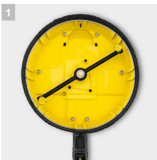
1 Два вращающихся сопла

Для тщательной и аккуратной очистки больших площадей: приспособление для очистки поверхностей T-Racer T 5. Благодаря регулировке расстояния от сопел до очищаемой поверхности может использоваться для очистки как прочных, так и чувствительных поверхностей.