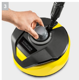
3 Настройка высоты